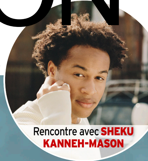
Rencontre avec SHEKU KANNEH-MASON